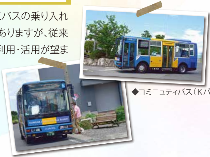
◆コミュニティバス(Kバス)

本年2月から小貝須、大貝須、立田・太平地区に1日4便Kバスの乗り入れが新たに加わりました。利用しづらい時刻表など問題点もありますが、従来からの安永・和泉を経由する南部ルートとともに、積極的な利用・活用が望まれます。路線見直しされたせつかくの公共交通も、利用者が減少すると、又、廃止の議論も生じてきます。桑名城南線(桑名駅~日の出橋間)とともに利用の拡大を図っていきましょう。